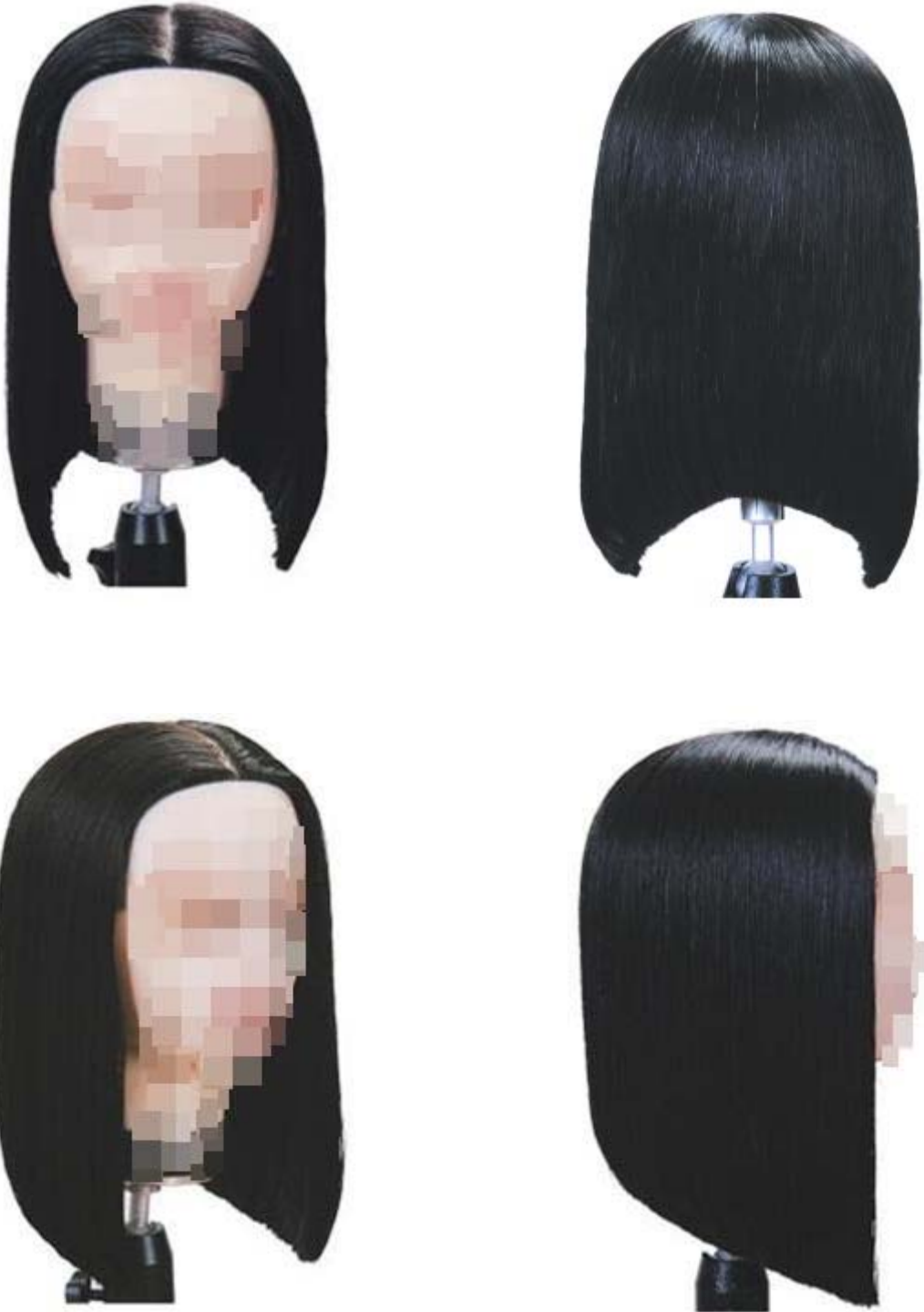
제1형 - 스파니엘 스타일 커트