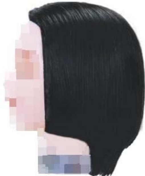
제3형 - 그라듀에이션 커트