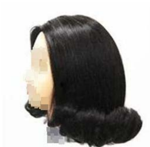
제2형 - 바깥말음(이사도라)