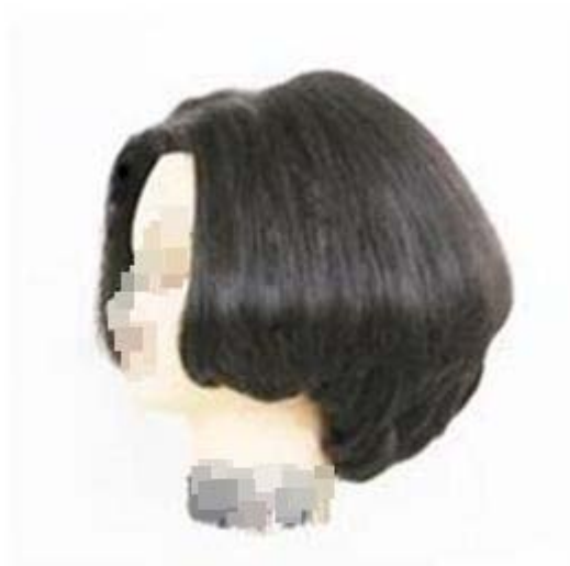
제3형 - 안말음(그래듀에이션)