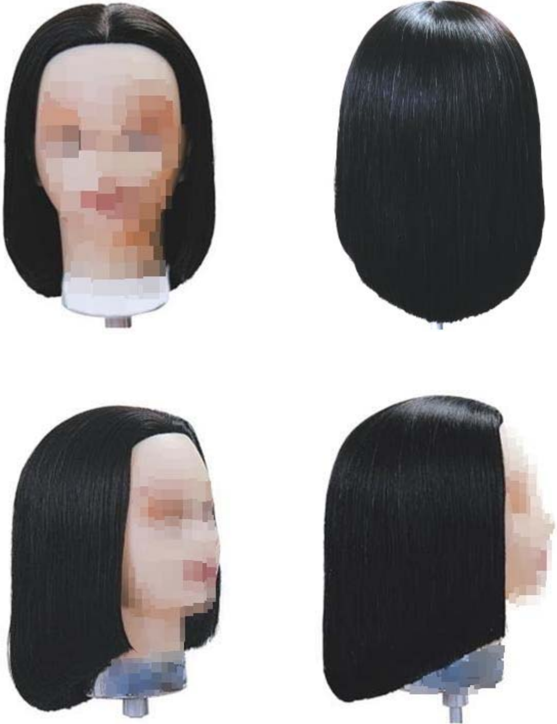
제2형 - 이사도라 스타일 커트